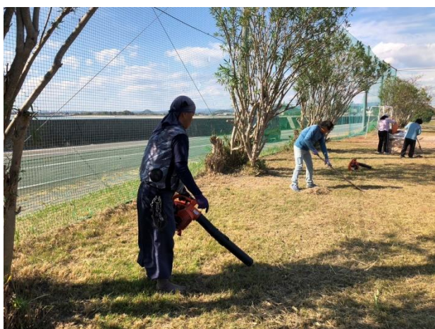
外作業 (おぎおん公園)