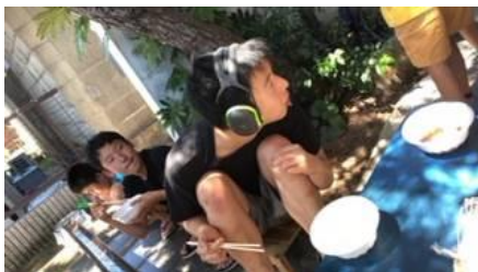
～夏休みの流しソーメン～