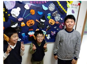
～今年のハロウィンは少し怖い～