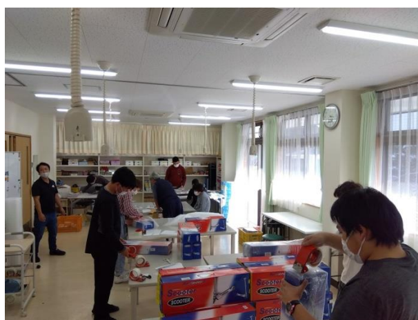
梱包作業 (ケイズプランニング)