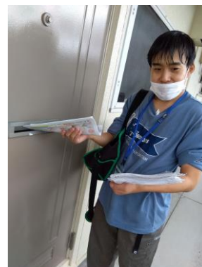
ツイスト線のテープ巻き作業 (大熊工業) とポスティング (サンデー西京・ほっぷ)